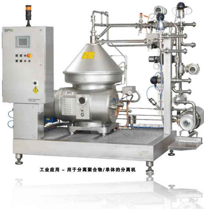
工业应用 - 用于分离聚合物/单体的分离机