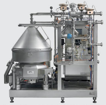
乳制品应用 - 牛奶离心机配套自动奶油标准化系统