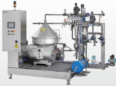
酒精饮料 - 果汁、葡萄酒和汽酒澄清器

流体的机械分离与澄清，需要透过细致的处理，来有效地去除各种类型与尺寸的悬浮固体，以保证最终产品的质量。使用最广的分离方法是采用垂直碟片堆叠的离心机，这种堆叠技术对于碟片设计是一项重大的挑战，最终造就出对产品影响最低的优化分离过程，同时保证能源效益，可靠的运行和高安全性。