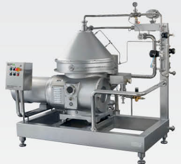
生物技术应用 - 用于乳酸菌回收的澄清机