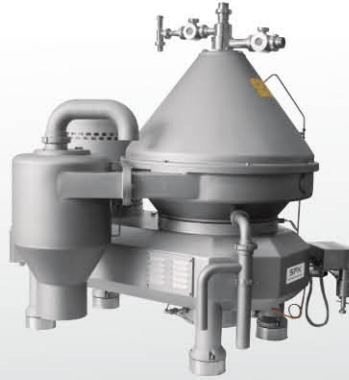
油脂 - 分离器用来回收玉米油