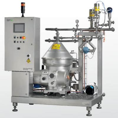
乳制品 - 牛奶离心机配套自动奶油标准化系统

Seital系列碟片式离心机提供密封式、卫生级、气密性和防爆设计可选，采用高级抗腐蚀不锈钢材料，旨在确保对流体和悬浮固体进行轻柔、经济的分离，同时保证高可靠性与安全性。