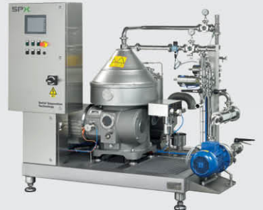
酒精饮料应用 - 果汁、葡萄酒和汽酒澄清机