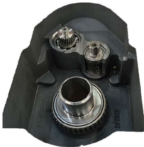
Compact 系列内部构造特色 三级减速以及干井结构

平行轴齿轮箱的结构简单，使得 Compact 系列的齿轮箱在运作时产生最低的噪音，运行也十分平稳。这种规格的齿轮箱，齿轮箱润滑油的油温升幅很小，相较于其他驱动配置，这将有助于延长润滑期限。您无需额外润滑轴承：轴承将使用齿轮油进行润滑。这种创新将大幅降低由于弯曲荷载使齿轮移位的可能性，减少齿轮的磨损，并使得噪声更低，运行更平稳。