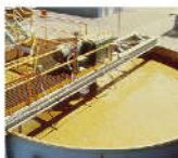
采矿、能源和电力领域的矿浆处理

在矿及水处理领域中, 主要采用敞口式搅拌机。Compact 系列拥有一体铸造式的齿轮箱。我们可以提供适配器板来配合您现有的结构, 以帮助您更换旧设备。